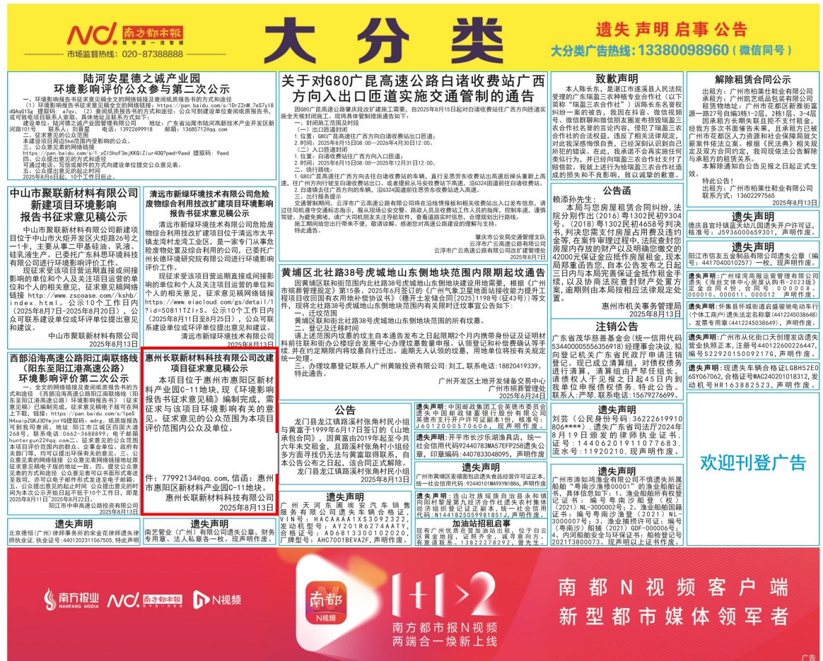
图 3.2-2 征求意见稿第一次报纸公示