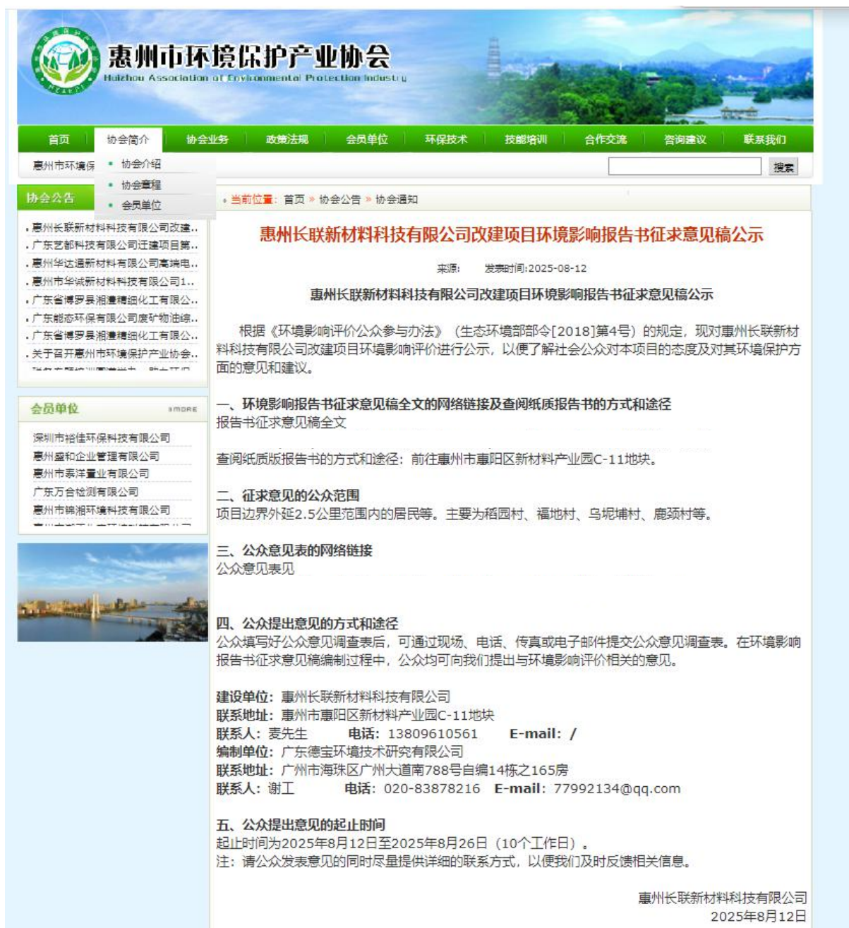
图 3.2-1 征求意见稿公示