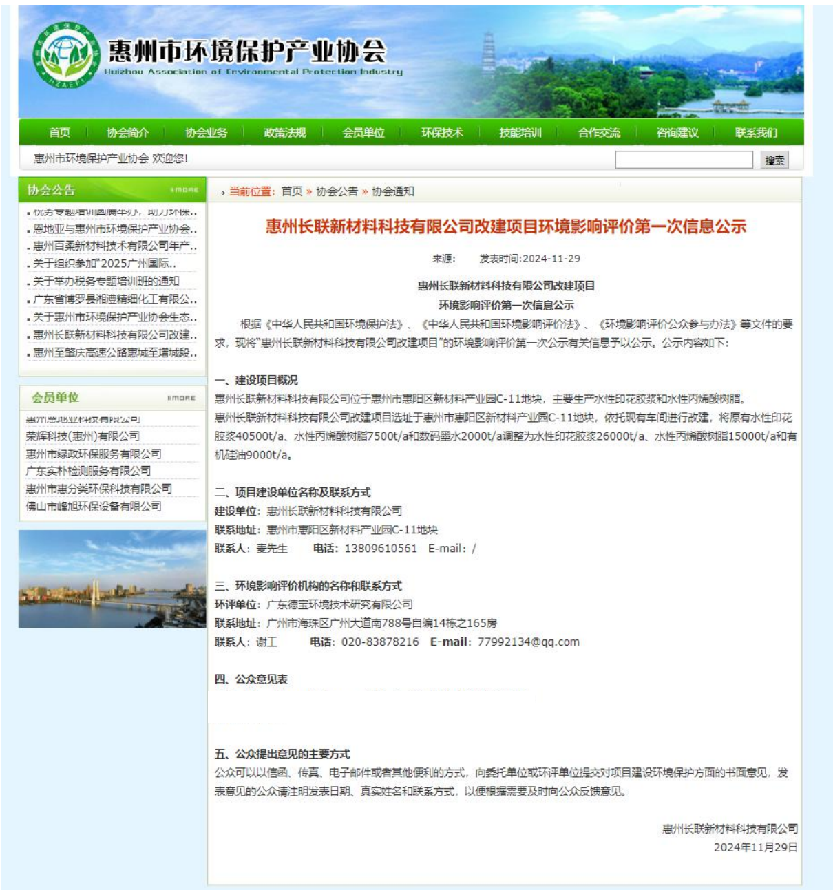
图 2.2-1 首次信息公开截图