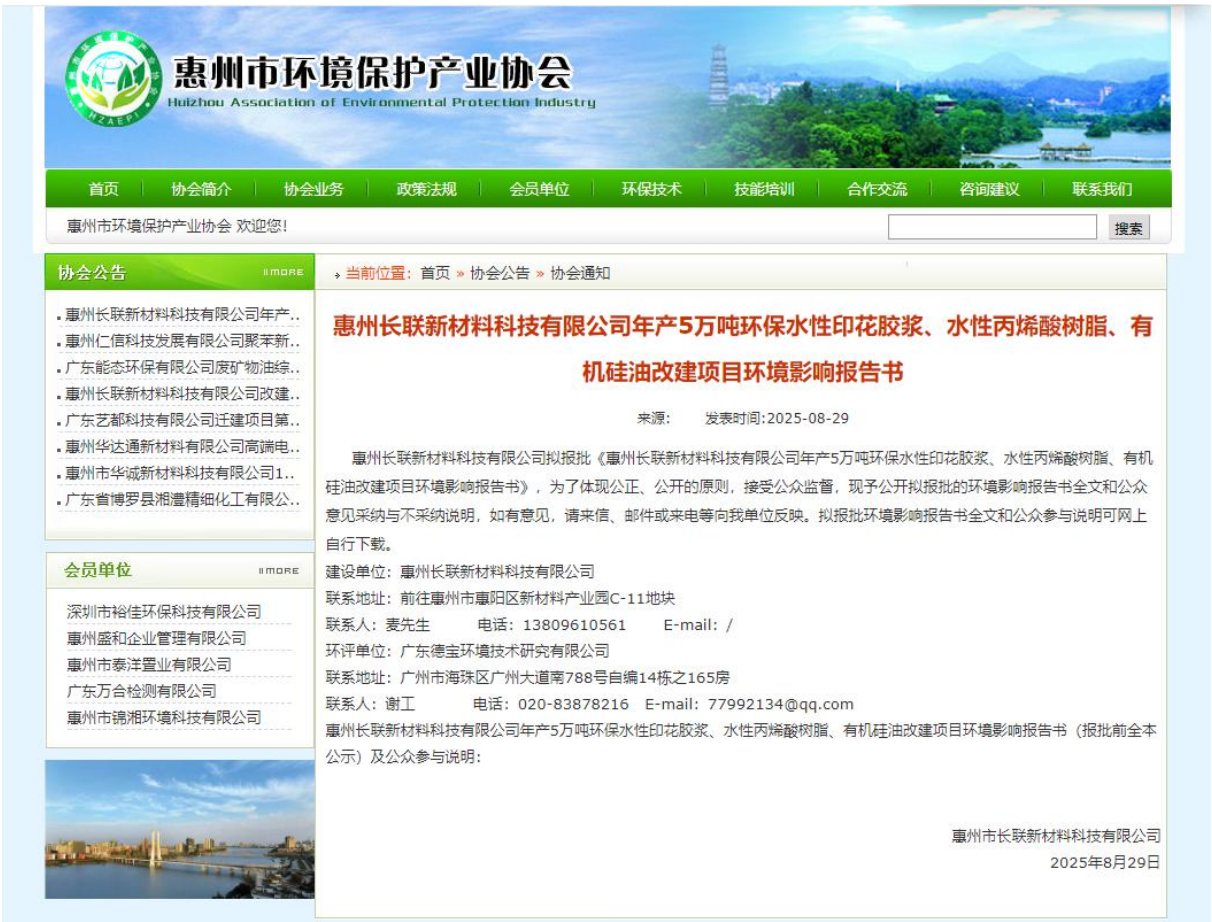
图 5.1-1 报批前公示截图

公开内容主要包括：《惠州长联新材料科技有限公司年产 5 万吨环保水性印花胶浆、水性丙烯酸树脂、有机硅油改建项目环境影响报告书（报批前公示稿）》和《惠州长联新材料科技有限公司年产 5 万吨环保水性印花胶浆、水性丙烯酸树脂、有机硅油改建项目公参说明》，可通过下面链接查看：