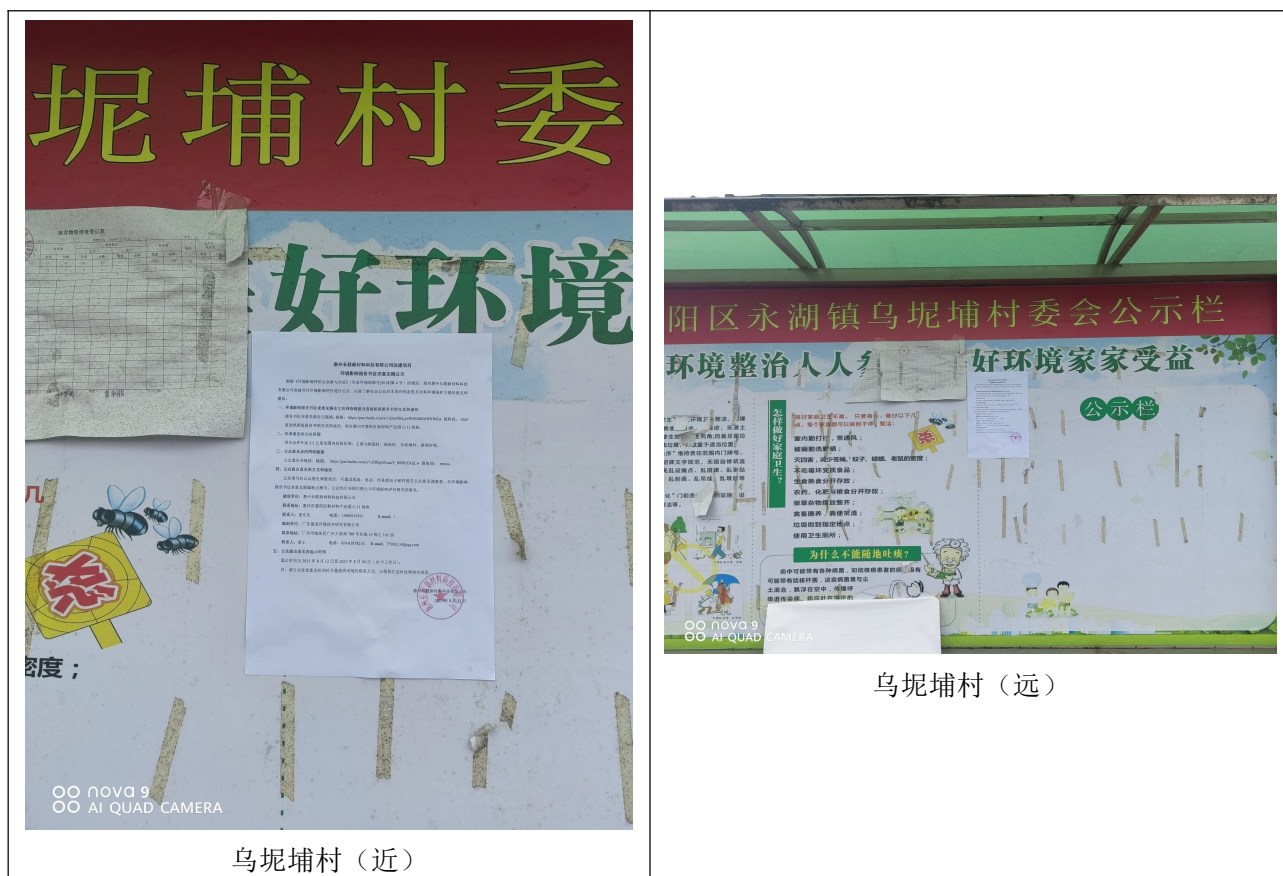
图 3.2-4 征求意见稿现场张贴公示