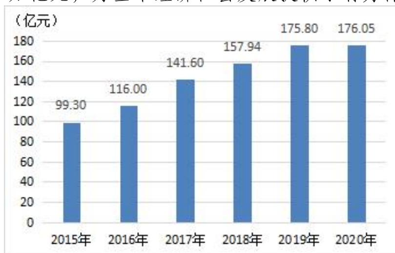
图 3：“十三五”期间惠州市保费收入情况

保险市场健康稳定发展。“十三五”期间，我市保险业持续健康发展。2020 年全市实现保费收入 176.05 亿元，较 2015 年增长 77.29%，年均增长 12.13%；保险密度和保险深度分别为 3607 元/人、4.2%，较 2015 年分别提高 1512 元、1 个百分点；全市各项赔付支出 49.33 亿元，比 2015 年增长了 17.59 亿元。保险种类涵盖涉农保险、大病二次补偿保险、人身意外伤害保险、健康保险、车辆保险、大病保险、自然灾害责任保险、巨灾保险等，保障金额 6.52 万亿元，为全市经济社会发展提供了有力保障。