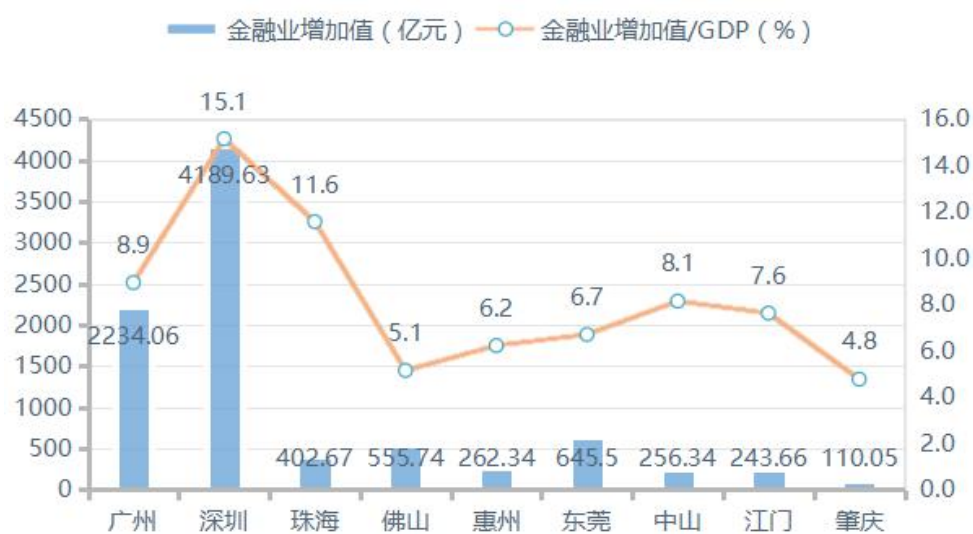
图 1：2020 年末珠三角城市金融业增加值及 GDP 占比图